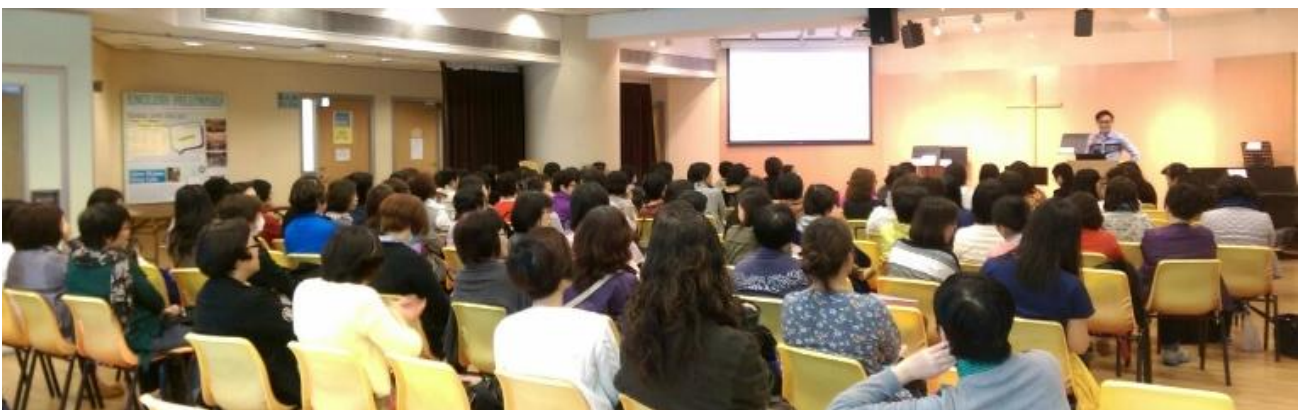
2016 年 4 月 20 日恩福堂講座分享，參加者 200 人。