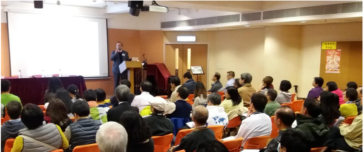
2016年11月19日「同性婚姻 迫在眉睫 台灣同運最新形勢分析」講座，參加者約70人。